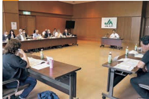
▲ 情勢報告を聞く農政対策委員

J Aは6月6日、営農経済本部で令和5年度第1回J A八戸農政対策委員会を行い、農政対策委員15人が参加しました。