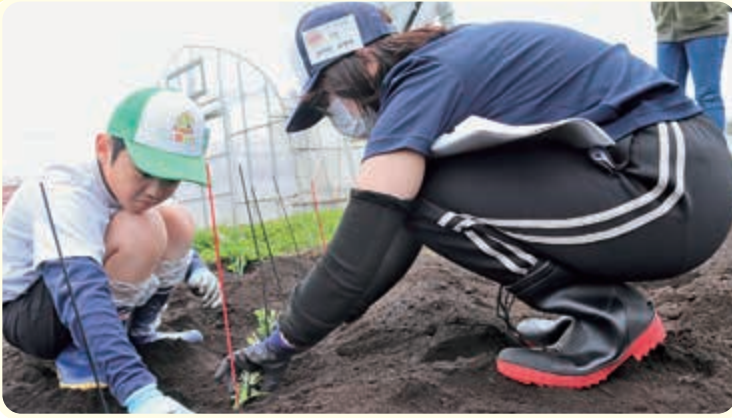
▲ 食用菊の船底植えに挑戦する塾生