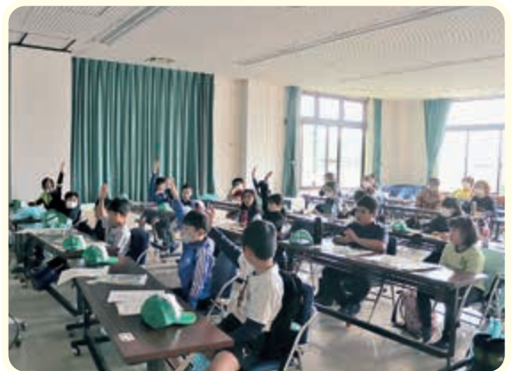
▲ 元氣よく手をあげる塾生

次回のキッズあぐり塾は、7月29日に行い、ピーマン、糠塚きゅうりやミニトマトの収穫を行うほか、ミニトマトや糠塚きゅうりの葉かきやちやぐりんの授業を行う予定です。