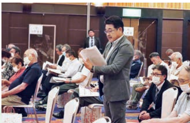
▲ 意見を述べる総代