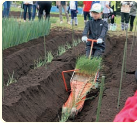
▲ ねぎの移植をする塾生

マンの植え付けに挑戦。食用菊の船底植えを体験したほか、簡易移植機ひっぱりくんを使用し、長ねぎの移植を行いました。新人職員が手助けしながら、苗に土をかぶせ、塾生は「大きく育ってね」と声掛けしました。