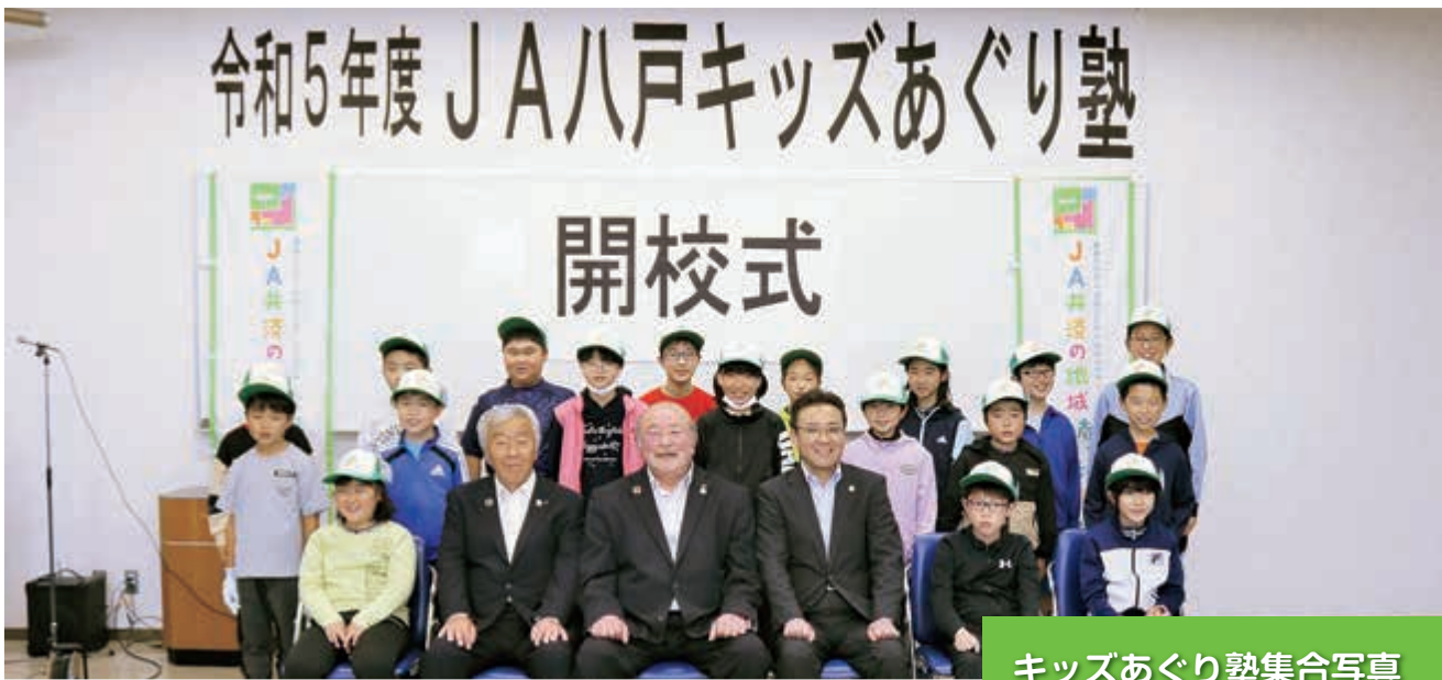
キッズあぐり塾集合写真