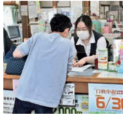
▲ 受賞した田子支店