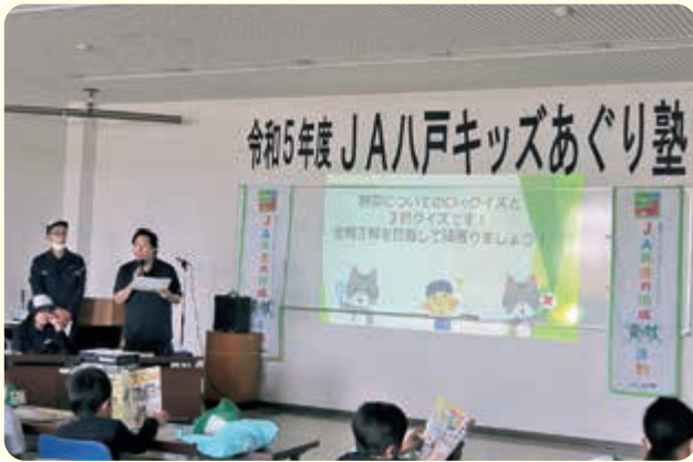
▲ 野菜クイズを出題する新人職員

先生が、パワーポイントを使い、「①いちご、②レモン、③ピーマンのうち、いちばんビタミンCが多い野菜は?」「トマトの色には赤や黄色のほか黒もある、○か×か?」などの野菜クイズを出題。「③ピーマンが、いちばん多い」「スーパーで黒いトマトをみたことがあるから、○だ」と塾生たちも元氣よく手をあげ、答えを友だち、兄弟同士で考え答えました。