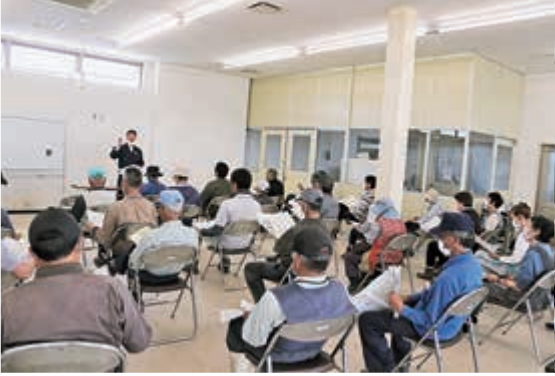
▲ 収穫適期を説明する講師

にんにく専門部は6月5日、6日に、管内15カ所でにんにく栽培講習会を行いました。このうち5日に五戸営農センター(東部)で行った講習会では33人が参加しました。