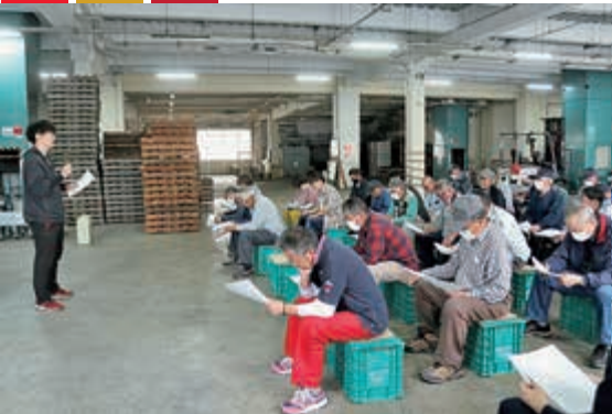
▲ 出荷規格を説明する販売担当

プラム・プルーン専門部は6月23日、早生・中生種の目揃会を三戸営農センターで開催し、生産者や市場などが参加しました。