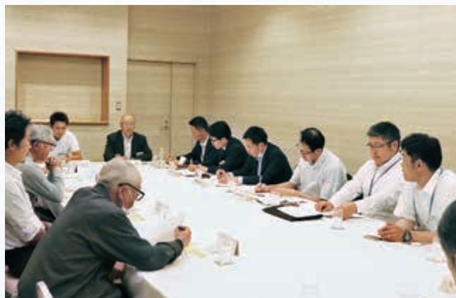
▲ 情報交換会の様子

③ねぎ・きゅうり、④トマト・ピーマン、⑤ミニトマト・豆類、⑥振興野菜と6会場に分かれ、活発な意見交換を行いました。各会場では、品目毎の前年度の実績や今年度の計画、作柄や出荷状況を報告したほか、市場への要望が多数出されました。