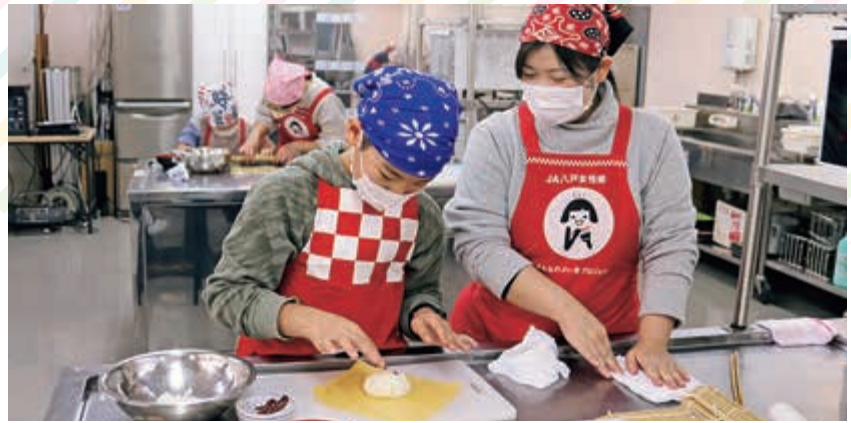
▲ 茶巾寿司を作る親子