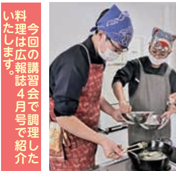
今回の講習会で調理した料理は広報誌4月号で紹介いたします。