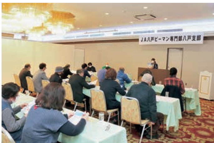
▲ 注意点を呼びかける講師

ピーマン専門部八戸支部は2月21日、八戸パークホテルで講習会および販売報告会を行い、生産者19人が参加しました。