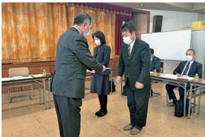
▲ 褒賞を受け取る横田支店長(左)と川口支店長(右)

J Aは2月22日の支店長会議において、J A八戸月間優績店舗表彰を行いました。