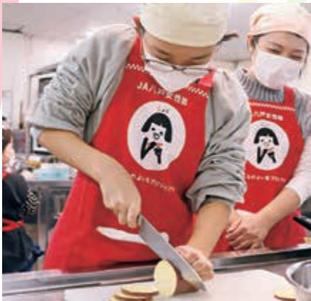
▲ サツマイモを切る児童