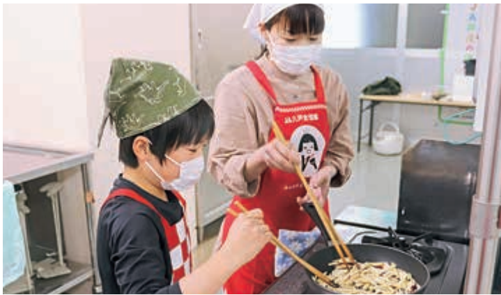
▲ サツマイモを炒める親子

や醤油などで味付けしました。完成した巻き寿司は、講師の店舗で実際に使用している折り詰にいれ持ち帰り、家族と一緒に食べました。 参加した児童は「サツマイモを切るのが大変だった」「上手に巻きずしを作ることができよかった」と感想を話しました。