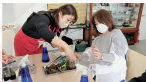
▲ 植え方を教える講師(左)

冬美活講座とは、JA八戸管内の女性を対象に、衣食住・健康・福祉・環境・文化・美容などの教養を高めると共に、新しいことへのチャレンジや新しい趣味の発見、癒しの時間づくりなどの目的で開催しています。令和4年12月から令和5年3月までに全4回予定しており、今回は第3回目の講座を開催しました。