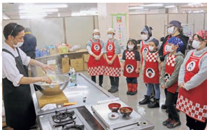
▲ 酢飯の作り方を教える講師

に混ぜ、ご飯になじませるようにしてください。酢の角がとれて、まろやかな味になります」とアドバイスしました。のりの上部1cmくらいを空けて酢飯を広げ、マグロ、海老などの海鮮をふんだんに乗せ、親子で協力し形を整え完成しました。さらに、かன்பいようや梅を乗せ細巻き2本を作ったほか、初級者向けのふくさ包みの茶巾寿司を作り