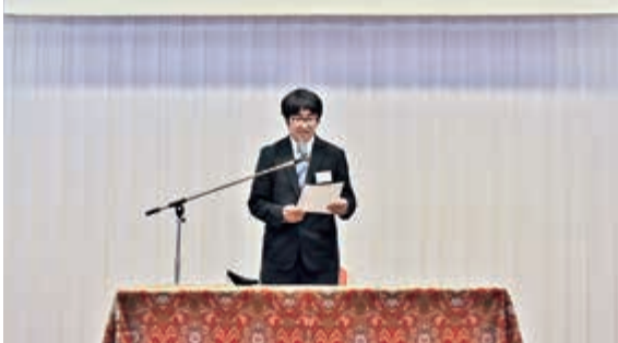
▲ あいさつをする高村部長