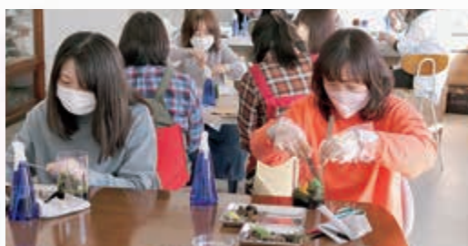
▲ 苔テラリウムを作る参加者

ずつ埋め込み、溶岩石を置いたり、白い砂で海を表現するなど思い思いの作品を完成させました。