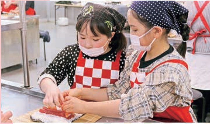
▲ 巻き寿司を作る参加者

また、家の光12月号掲載の「さつまいもきんぴら」を調理しました。「さつまいもきんぴら」のサツマイモは今年度開催した「紅はるか」を使用。子どもたちは固くて切りにくいサツマイモを包丁でゆっくり細切りにし炒め、味噌